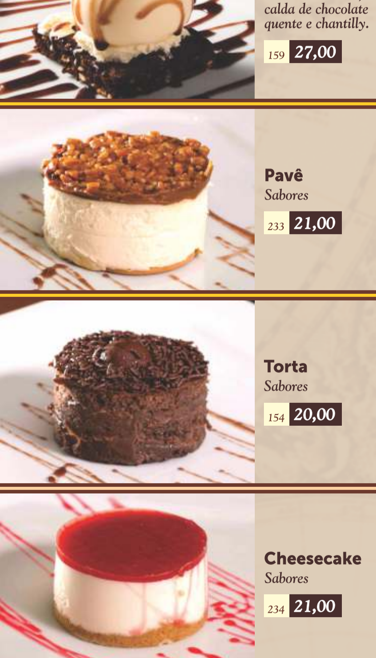
Brownie Bolo de chocolate, sorvete de creme, calda de chocolate quente e chantilly.