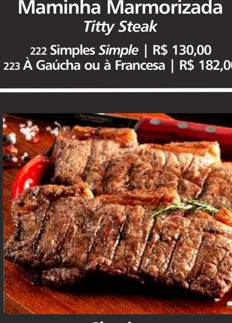
Maminha Marmorizada Titty Steak

222 Simples Simple | R$ 130,00 223 À Gaúcha ou à Francesa | R$ 182,00