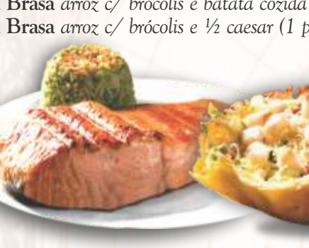
batata rústica rustic potato

À Francesa Presunto, batata palha, petit pois e cebola. Acompanha: batata rústica Straw potatoes, ham peas and onions accompanied: rustic potato